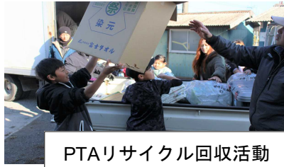
PTAリサイクル回収活動