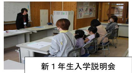
新1年生入学説明会