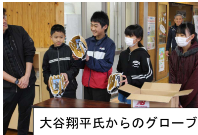
大谷翔平氏からのグローブ