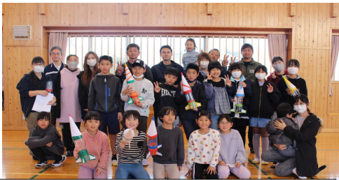
三校PTA合同（笠木・菅牟田・恒吉）家庭教育学級：ペットボトルロケット製作

2月もいろいろな活動がありました。子供たちは、毎日、楽しい学校生活を送っています。